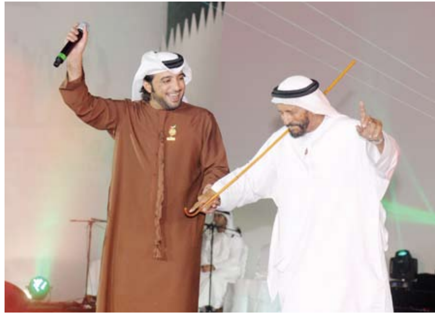
احتفالات العيد الوطني تتواصل بمدينة العين