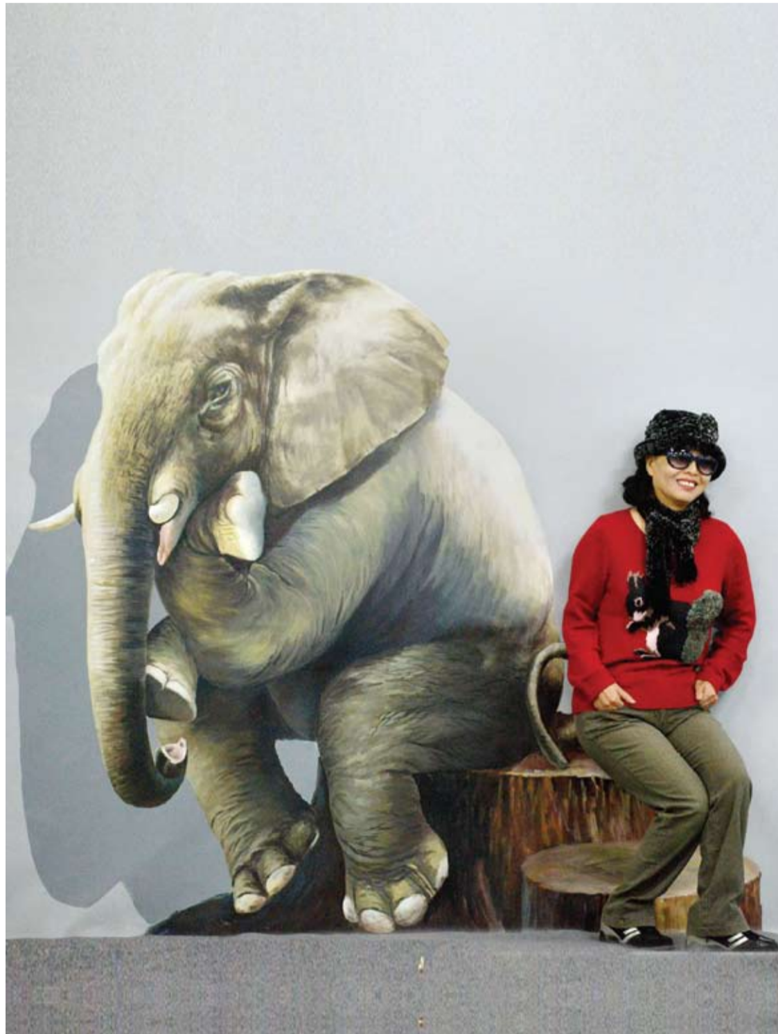
امراة تجلس بجوار لوحة 3D ثفيل خلال معرض سحر الفن في بكين.

-التمرين الرابع: أميلي صدرك إلى الأمام بحيث تكون ساقل متباعدتين ويديك ممدودتين إلى الجانبين، حرّكي صدرك إلى اليمين ثم إلى اليسار مع توجيه اليد نحو أطراف أصابع القدم العاكسة. اليد اليمنى نحو القدم اليسرى والعكس صحيح، مع إبقاء الظهر جالساً.